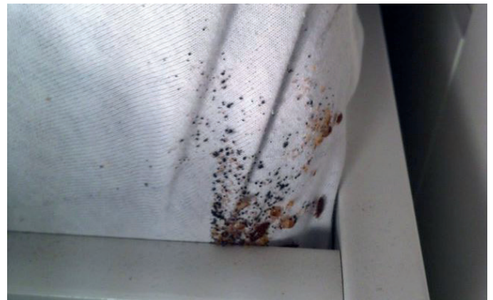
Vägglössens spillning syns som små svarta prickar.