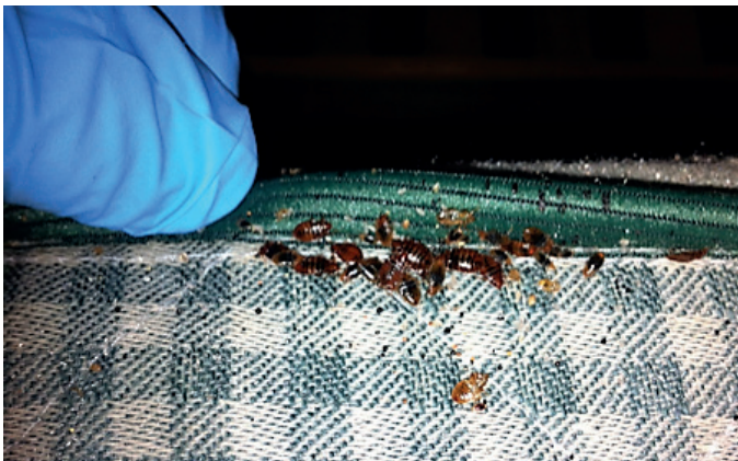
Så här ser en ansamling av vägglöss i madrassen ut.