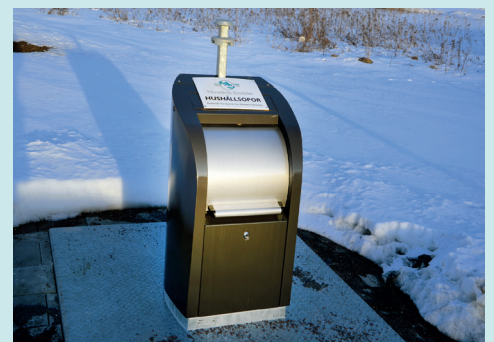
Blomstermåla ska få en ny sophantering likt den i hamnen i Mönsterås.

Älgerum, Mönsterås Bryggerigatan 5, Mönsterås Hamngatan 25-75, Mönsterås Jacobs Gränd 7, Mönsterås Johan Skyttes väg 17, Ålem Fliseryd